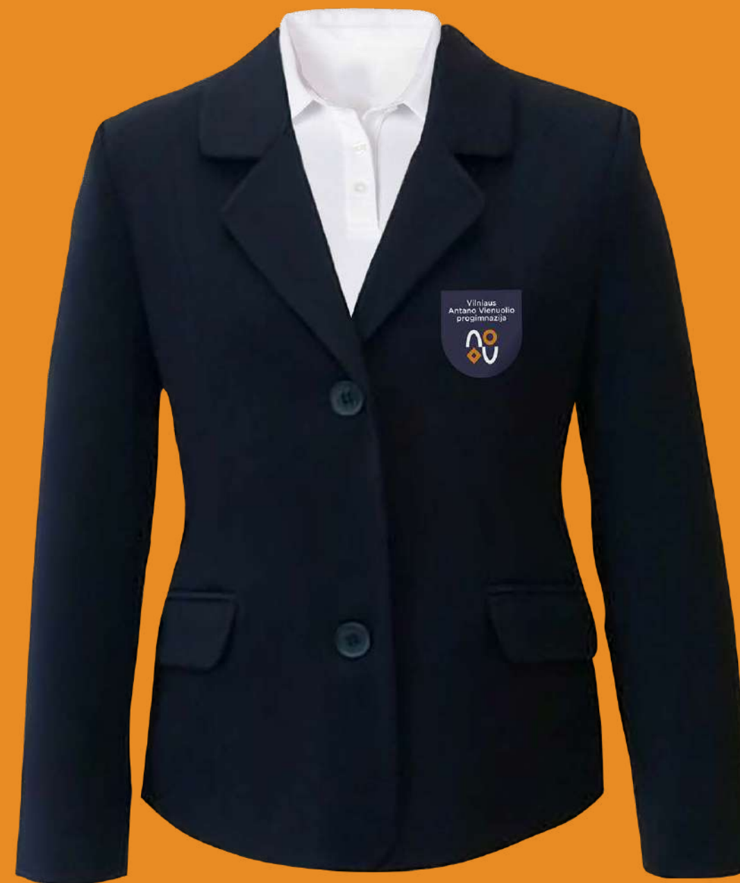
Švarkas ir balti marškinėliai (gali būti be aksesuarų)