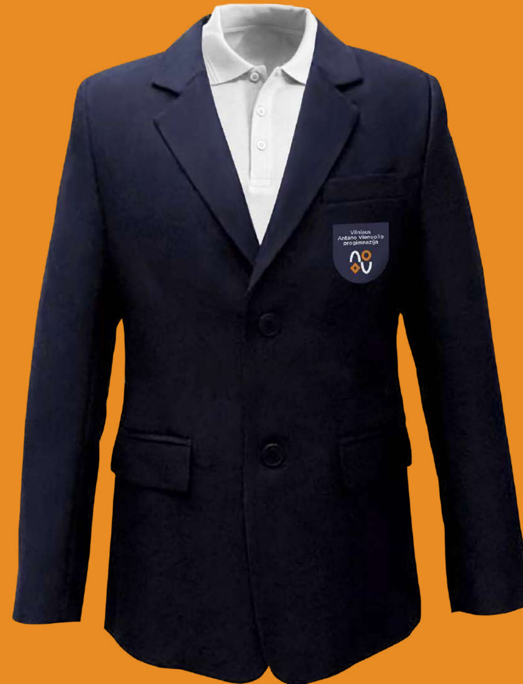
Švarkas ir balti marškinėliai (gali būti be aksesuarų)