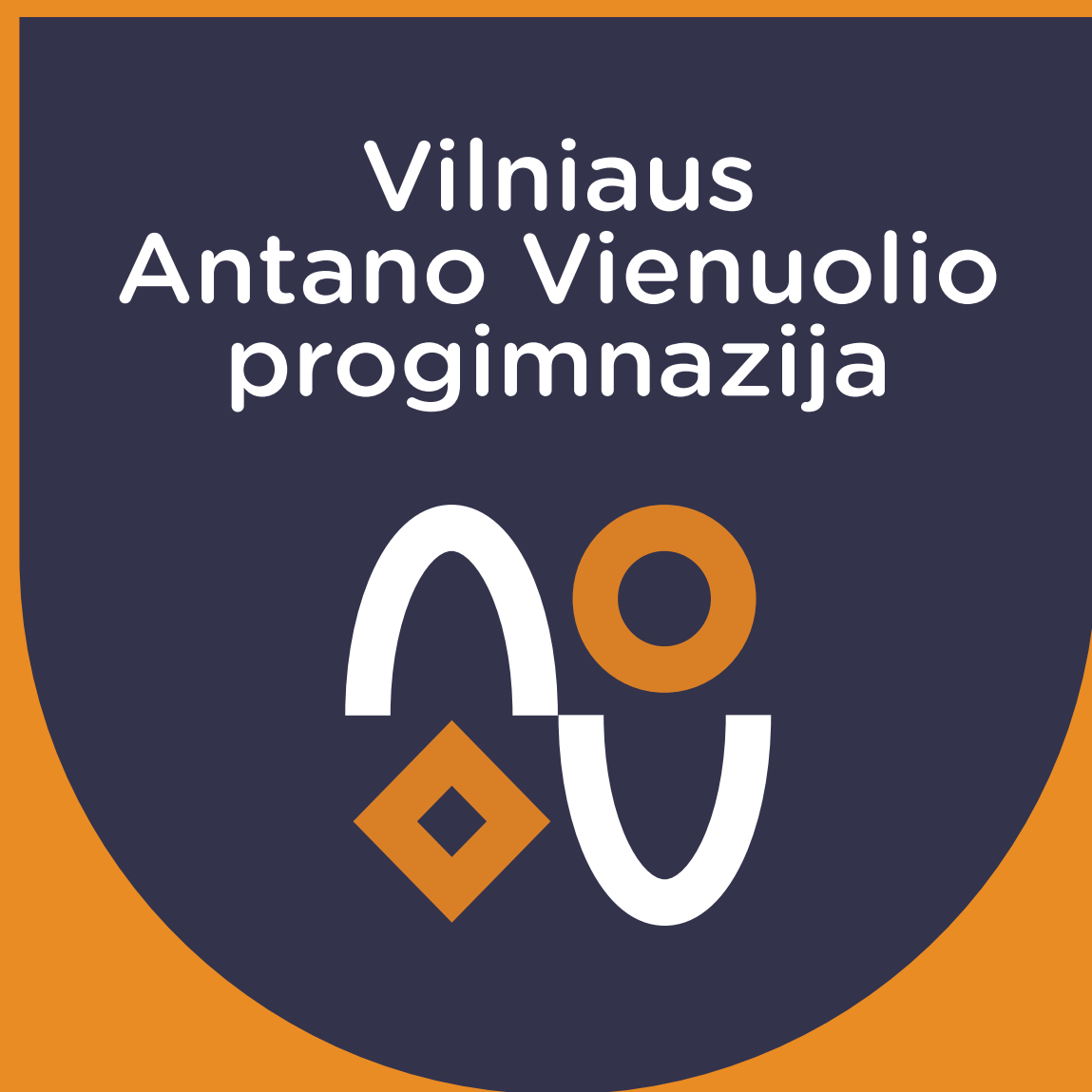
Medžiaginė, prisiūnama emblema 65x65 mm.

Visi dėvimi švarkai, megztukai ar džemperiai turi būti paženklinėti progimnazijos ženklu.