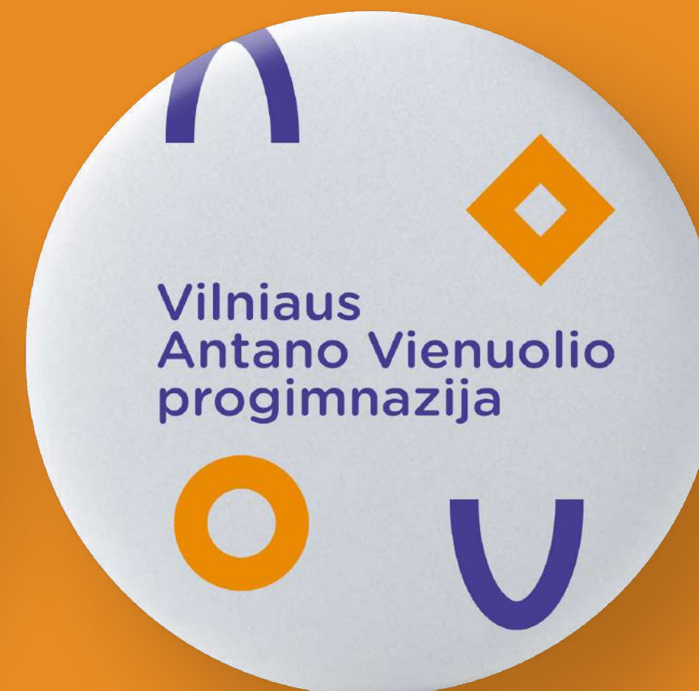
Prisegamas ženkliukas 55x55 mm.