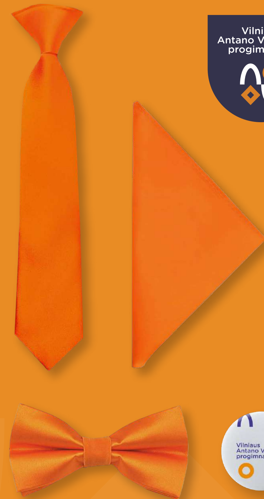
Aksesuarai pagal poreikį ir galimybes